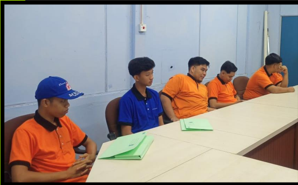
SAFETY BRIEFING NEW STUDENT KTSKILLS 20 MARCH 2023