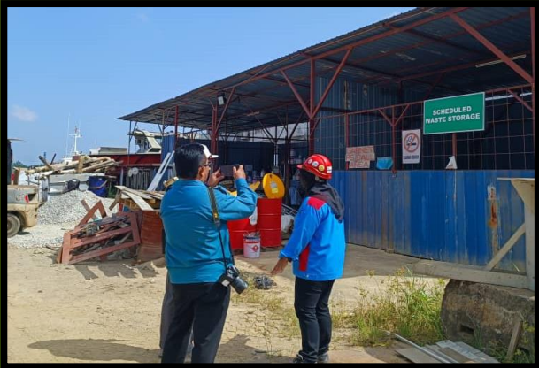
INSPECTION SCHEDULED WASTE BY DOE (MSETPK) 15 MARCH 2023