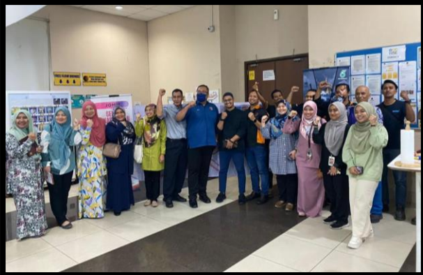
BE A HERO, BE A DRUG ZERO 1.11.2023