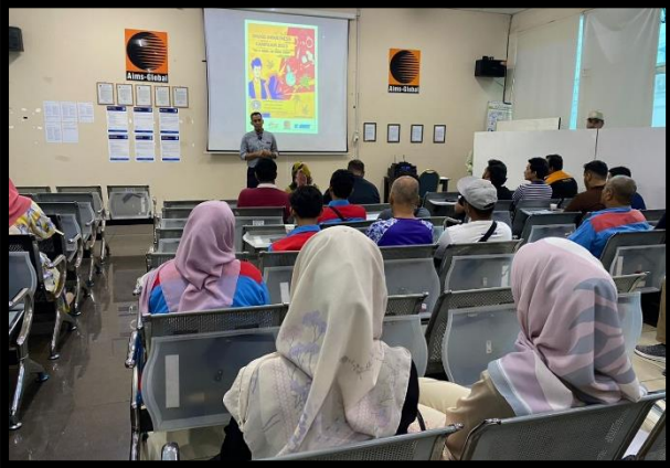
FIT TEST RESPIRATORY TRAINING (MSET & PDSC) 14.11.2023