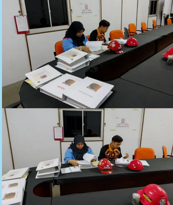
MANAGEMENT VISIT & MONSOON ZIZA CAMPAIGN MOORING GANG 14.10.2024