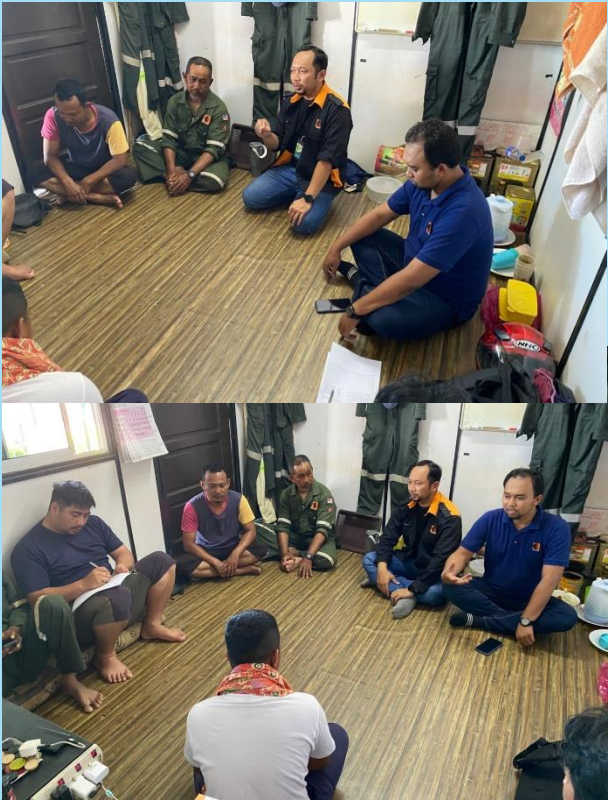
RANDOM UDAT PB CREW 2 PAX 14.10.2024