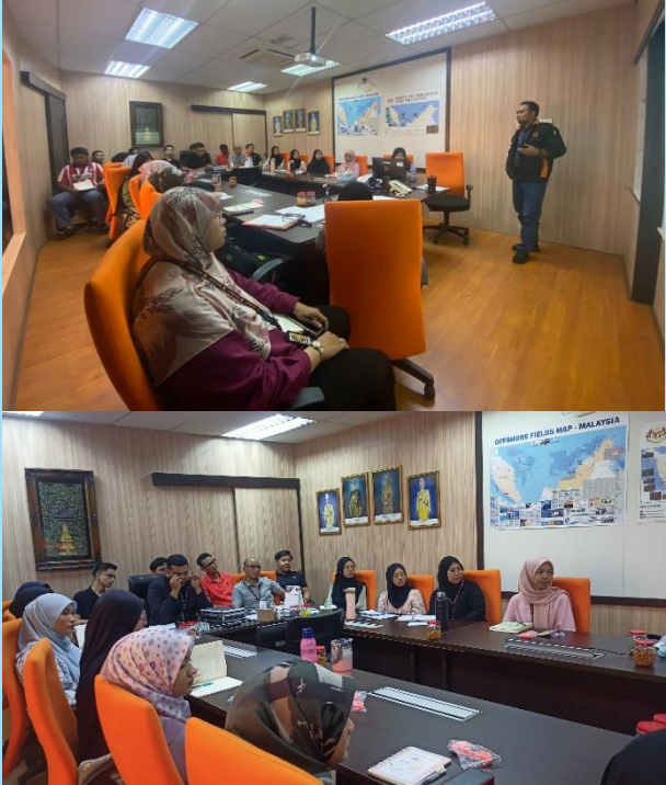
CROSS AUDIT AGMHE 12.10.2024