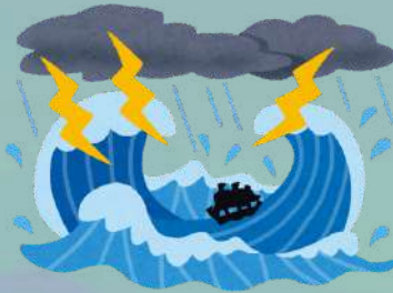
ANGIN KENCANG & LAUT BERGELORA