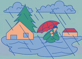
HUJAN LEBAT & BANJIR