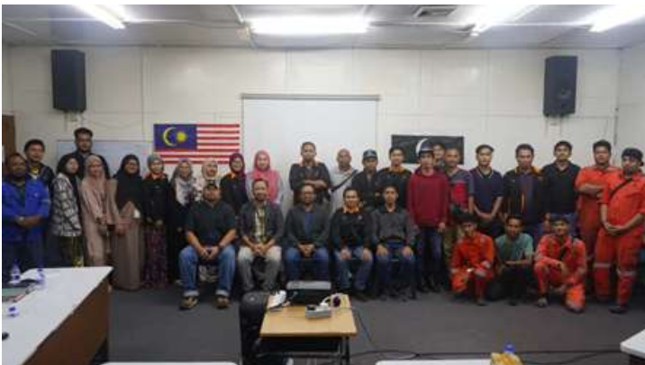
MENTAL HEALTH AWARENESS AT WORKPLACE FOR SECURITY 14.10.2025 & 16.10.2025