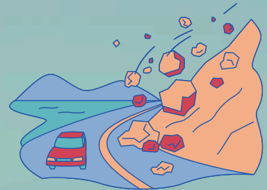
TANAH RUNTUH & HAKISAN