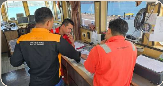
3. HSE PLAN 2026 ROLL OUT & SMS MANUAL LATEST REVISION BRIEFING AA5 - 16/03/2026