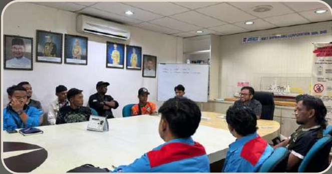
1. SAFE FOR RAYA 6.0 - KESELAMATAN RUMAH DAN JALAN RAYA TANGGUNGJAWAB BERSAMA di MSET- 11/03/2026